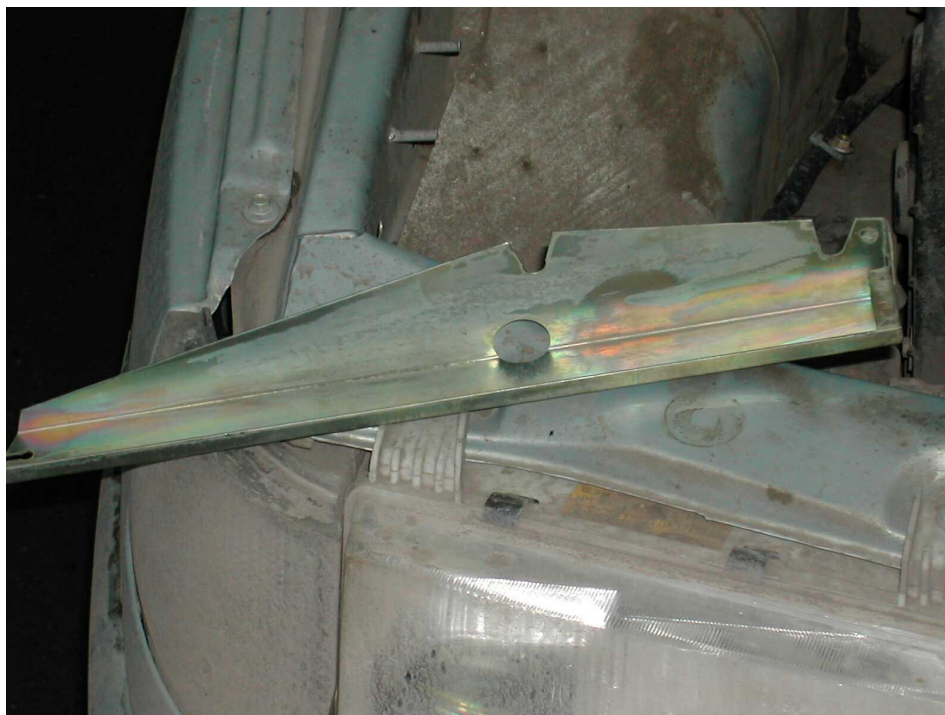
Так выглядит защита замка капота для ВАЗ 2110. (вид с обратной стороны)